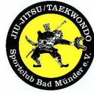
SC Bad Münster (seit 1989)